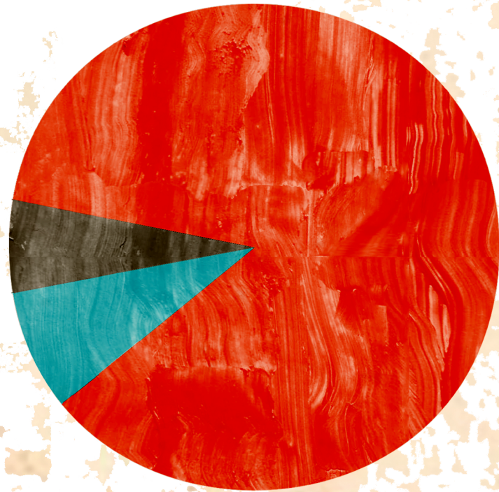
Provenance du financement des universités 1988

La hausse des frais de scolarité universitaires est plutôt une façon pour le gouvernement de se désengager du financement des universités et ainsi, ouvrir la porte à la privatisation et à la tarification.