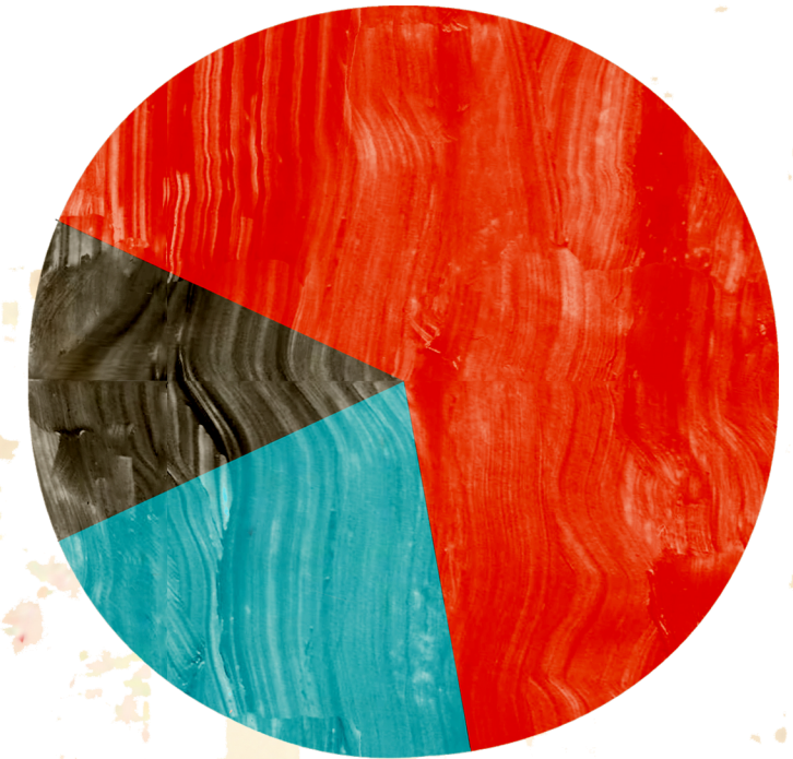
Provenance du financement des universités 2009

La hausse des frais de scolarité universitaires est plutôt une façon pour le gouvernement de se désengager du financement des universités et ainsi, ouvrir la porte à la privatisation et à la tarification.